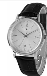
Esempi di modelli

Descrizione del difetto/malfunzionamento: