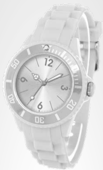
Esempi di modelli

Commercializzato da: KRIPPL-WATCHES WARENHANDELS GMBH MARIA-THERESIA-STRASSE 41 4600 WELS AUSTRIA