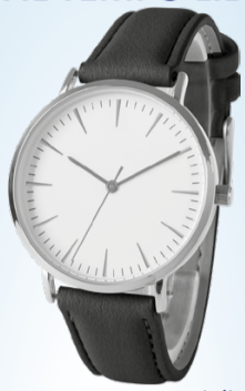
Esempi di modelli

Commercializzato da: KRIPPL-ELECTRONICS GMBH MARIA-THERESIA-STRASSE 41 4600 WELS, AUSTRIA