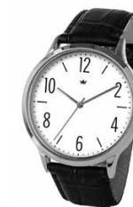
Esempi di modelli

Descrizione del difetto/malfunzionamento: